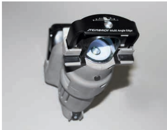
3-D Kantenschleifmaschine auch zum Hochglanzpolieren

An der Skispitze kann z.B. mit 2,85° begonnen werden und direkt unter der Bindung wird dann 7° erreicht